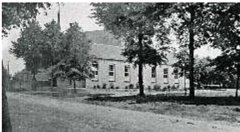
Het Bondsgebouw waar eerst de Landbouwschool in wordt gevestigd in 1922