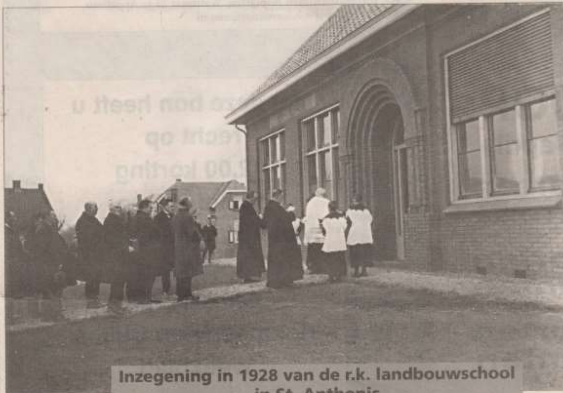
Inzegening in 1928 van de r.k. landbouwschool in St. Anthonis

SINT ANTHONIS, maandag 30 januari 1928 - De nieuwe landbouwschool aan de Perdshemel, de latere Kolonel Silvertoplaan, mag er zijn. Dat constateerden vandaag de vele aanwezigen na de inzegening van het gebouw. Alles is degelijk en netjes afgewerkt; architect en aannemer hebben alle eer van hun werk.