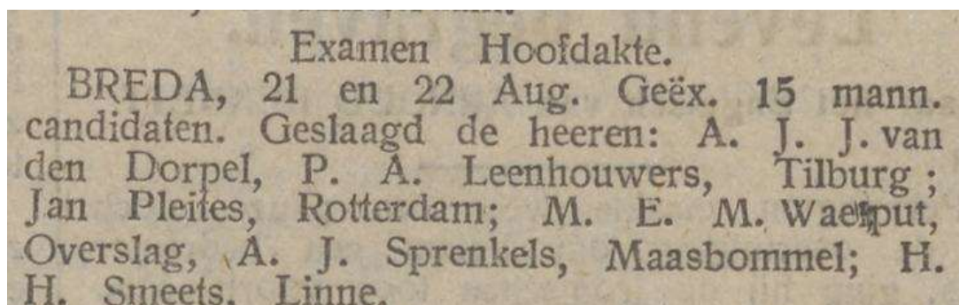
Uit: De Tijd – godsdienstig dagblad, 23-8-1912